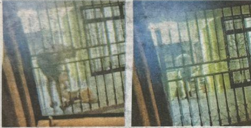
TANGKAP layar video kejadian seorang lelaki dipercayai merotan anjing peliharaan di Taman Perumahan Johor Jaya, Johor Bahru baru-baru ini.