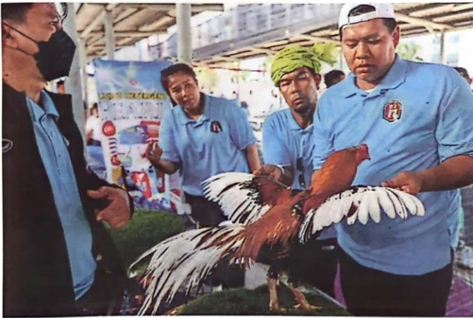
Prized bird: Members of the jury assessing Mongkut during the National Ayam Ratu Competition at a mall in Kota Baru.